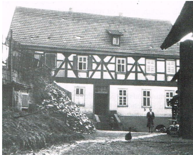
Alte Schule, Am Kirchberg 3

Früher - bis in die 50er Jahre hinein - bewegte sich die Zahl eines Oberzeller Schülerjahrgangs stets so zwischen zwanzig und dreißig. Um das herauszufinden, muss man nicht erst in alten Schulstatistiken nachforschen – ein Blick auf die in vielen Familien noch aufbewahrten Konfirmationsphotos zeigt, dass so ein Konfirmandenjahrgang immer um die 25 Jungen und Mädchen zählte.